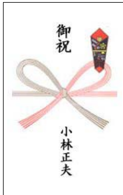
お祝い・お中元・お歳暮